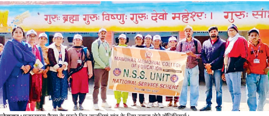
फतेहाबाद। एनएसएस कैम्प के पहले दिन झलनियां गांव के लिए रवाना होते वॉलंटियर्स।