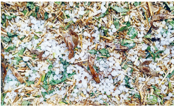
फतेहाबाद। शनिवार को गांवों में हुई ओलावृष्टि। (फाइल फोटो)

पश्चिमी विक्षोभ के प्रभाव के चलते 2 मार्च को जिले में बारिश व ओलावृष्टि हुई थी। जिससे जिले के 14 गांवों में ओलावृष्टि से फसलों को ज्यादा नुकसान पहुंचा। प्रदेश सरकार ने इस बारे उपायुक्त से खराबे की रिपोर्ट मांगी थी। उपायुक्त