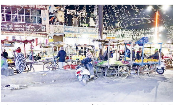
फतेहाबाद। फव्वारा चौक पर सड़क पर खड़ी रेहड़ियां।

शहर के फव्वारा चौक पर इन दिनों रेहड़ियों का जाल बिछा हुआ है। लाल बत्ती चौक व हंस मार्किट से थाना रोड के बीचों-बीच जाने वाले मार्ग पर पूरा दिन रेहड़ियों के कारण दुर्घटना होने का डर बना रहता है। दरअसल, फव्वारा चौक के आसपास के दुकानदारों ने रेहड़ी चालकों को दुकान के आगे की जगह किराये पर देकर उनसे हफ्ता वसूली कर रहे हैं। नगरपरिषद के ईओ राजेन्द्र सोनी का कहना है कि दुकानदारों को अल्टीमेटम दे दिया