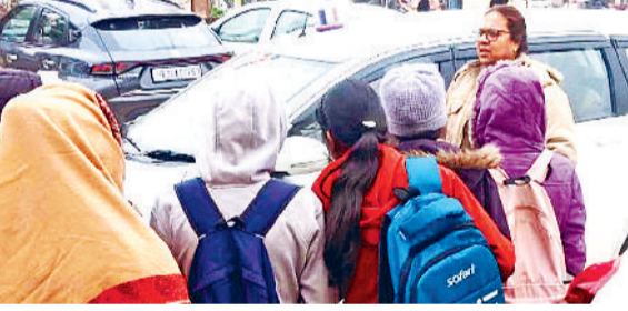
सिरसा। छात्राओं को डायल 112 के बारे में जानकारी देते महिला पुलिस।