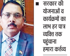
सिरसा। नवनियुक्त डीसी आरके सिंह।

नव नियुक्त उपायुक्त आर के सिंह ने कहा कि सभी विभाग सीएम विंडो, सोशल मीडिया व जनसंवाद कार्यक्रमों में आई समस्याओं को जनता की समस्याओं को प्राथमिकता के आधार पर निपटाएं। हमारा कर्तव्य सरकार की योजनाओं व कार्यक्रमों का लाभ हर पात्र व्यक्ति तक पहुंचाना है। वे मंगलवार को स्थानीय लघु सचिवालय के सभागार में विभिन्न विभागों के अधिकारियों की बैठक को संबोधित कर रहे थे। बैठक में उन्होंने अधिकारियों-कर्मचारियों