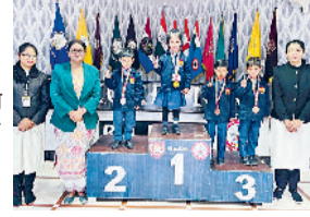
फतेहाबाद। रॉयल इंटरनेशनल रेंजिडेंटियल स्कूल में विजेताओं को सम्मानित करते स्कूल प्रबंधक।